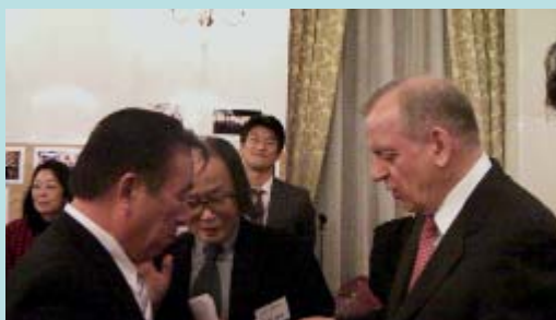
日ロ新時代に向けての集い ロシア大使から説明を受ける