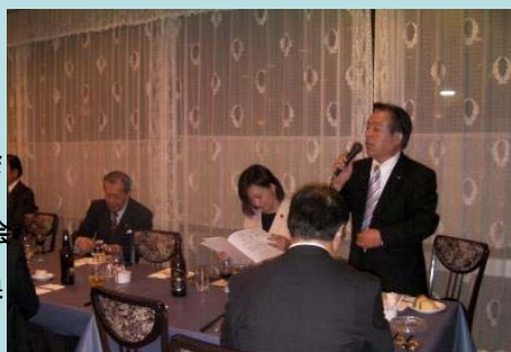
県選出国會議員と 市町村農業委員会 会長と農業政策に 関する要請・懇談会 次の日は意見交換