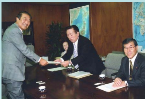
農林水産大臣 に「戸別所得 補償制度等」 に関する社民 党要望行動